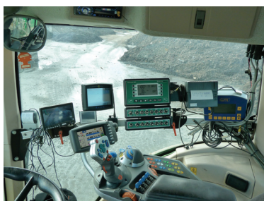
Sans : de nombreuses consoles