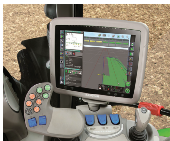
Avec : un terminal universel