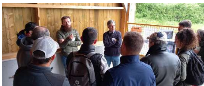
La Cuma Biomat témoigne