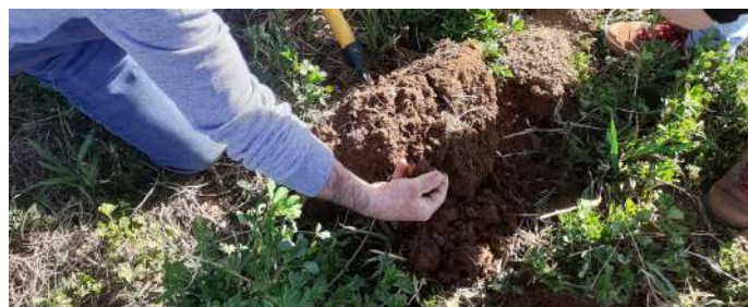
La Cuma de Bacchus se forme aux couverts végétaux

>>> Vous êtes intéressés ? Contactez-nous !