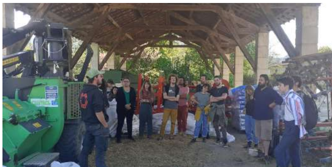
La Cuma Battages de Chamargès accueille le CFPPA de Die